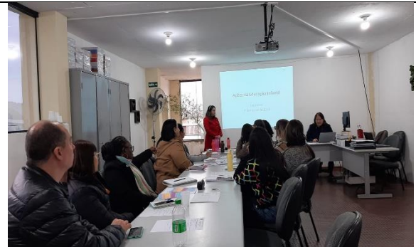
APRESENTAÇÃO SOBRE AÇÕES DA EDUCAÇÃO INFANTIL