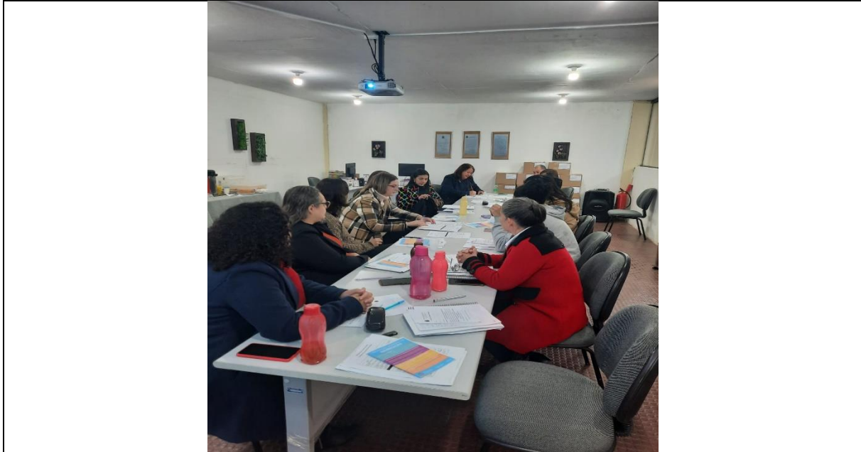
REUNIÃO COM COMISSÃO INTERSETORIAL DE MONITORAMENTO DO PMPI