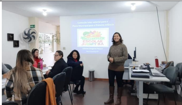
APRESENTAÇÃO SOBRE ALIMENTAÇÃO ESCOLAR