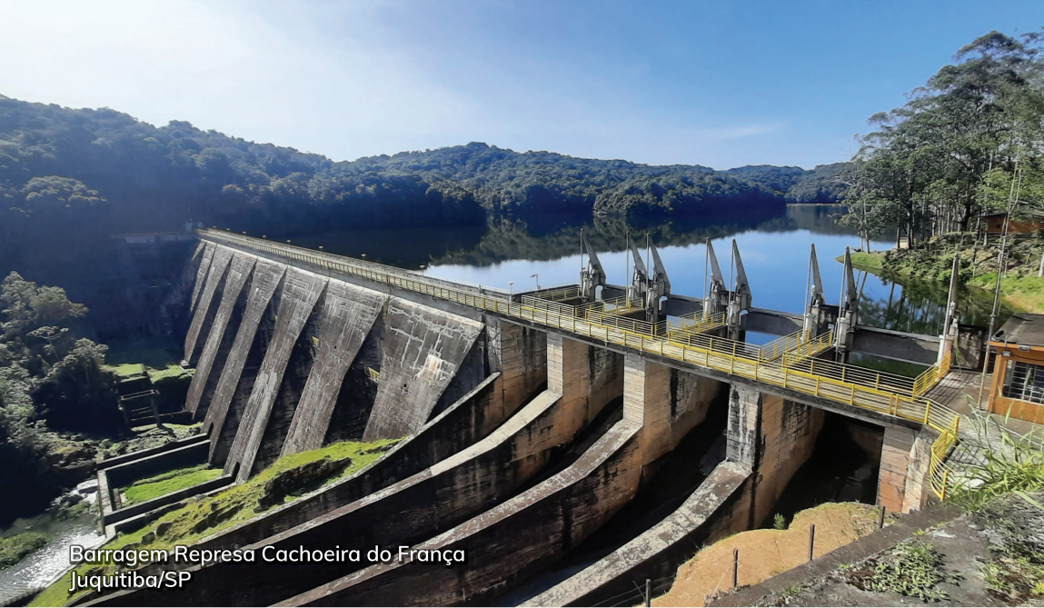
Barragem Represa Cachoeira do França Juquitiba/SP