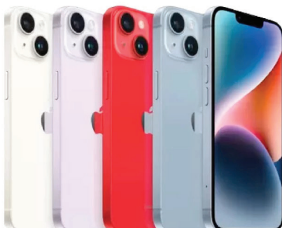
APPLE IPHONE 14 128GB 6,1" 12MP IOS 5G

O SORTEIO ACONTECERÁ DIA 15/03/2024. ÀS 14H.